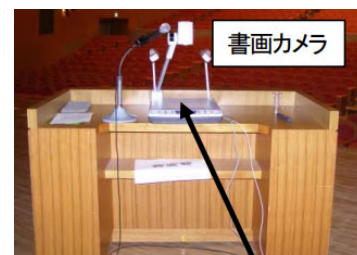
原稿をここに置く