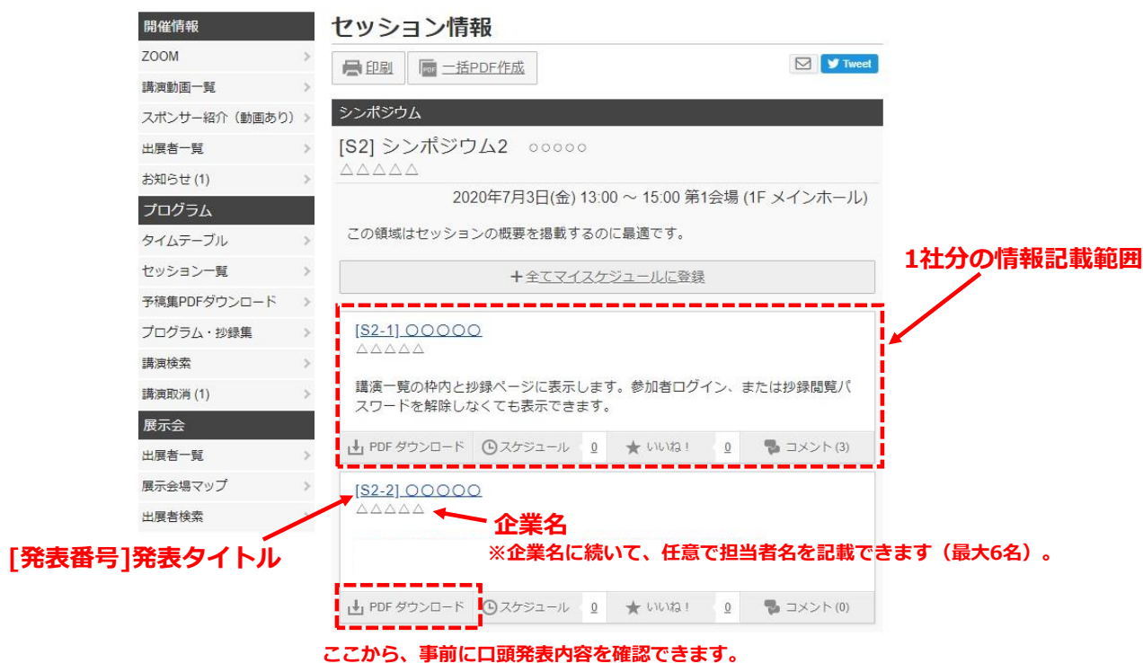
図-3 プログラム一覧への会社情報の掲載イメージ

研究集会の参加者が発表プログラムにて確認する画面の例を図-3 に示します。1つの発表セッションのプログラムが口頭発表順に掲載されており、各口頭発表の発表タイトル、所属、著者の情報が示されています。企業展・出展社様の場合は、企業 PR プレゼンでの発表タイトル、企業名、担当者名（任意）が掲載されます。『PDF ダウンロード』から事前に口頭発表の内容を確認することができます。