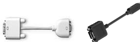
付属外部出力ケーブル 例